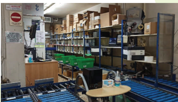
Οι εγκαταστάσεις του Συνεταιρισμού Φαρμακοποιών Λάρισας.

έχουν ολοκληρωθεί οι εν λόγω εργασίες σε όλους τους θεσσαλικούς νομούς, αφού η ομάδα μας ήδη έχει επισκεφθεί τις εγκαταστάσεις των άλλων συνεταιρισμών της Θεσσαλίας.