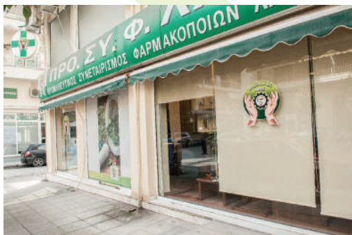
Οι εγκαταστάσεις του Προμηθευτικού Συνεταιρισμού Φαρμακοποιών Λάρισας - ΠΡΟΣΥΦΛΑ ΠΕ.

Αναζητήστε πληροφορίες στη θεματική ιστοσελίδα