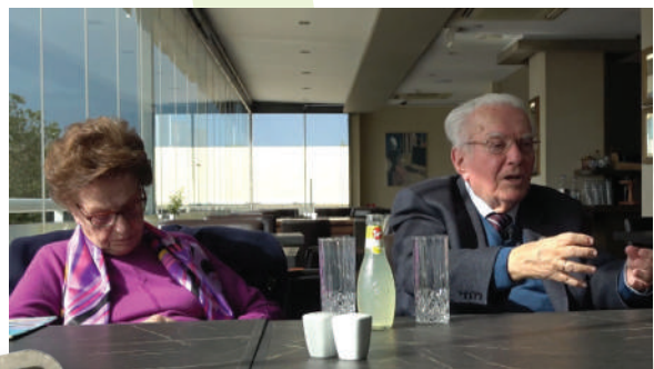
Στιγμιότυπα από το ντοκιμαντέρ για τον Συνεταιρισμό Φαρμακοποιών Θεσσαλίας Συν.ΠΕ - ΣΥ.Φ.ΘΕ με έδρα το Βόλο