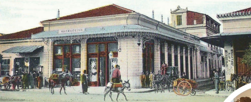
Το φαρμακείο Σφύρα (Δημητριάδος και Κοραή - Βόλος) σε καρτ ποστάλ του Στεφ. Στουρνάρα.

Φαρμακεμπορείον και Φαρμακείον Ζ.Α. Σφύρα (1889-1911) , Δημητριάδος και Κοραή. Το φαρμακείο ιδρύθηκε το 1889 και ο Ζ.Α. Σφύρας πέθανε το 1911.